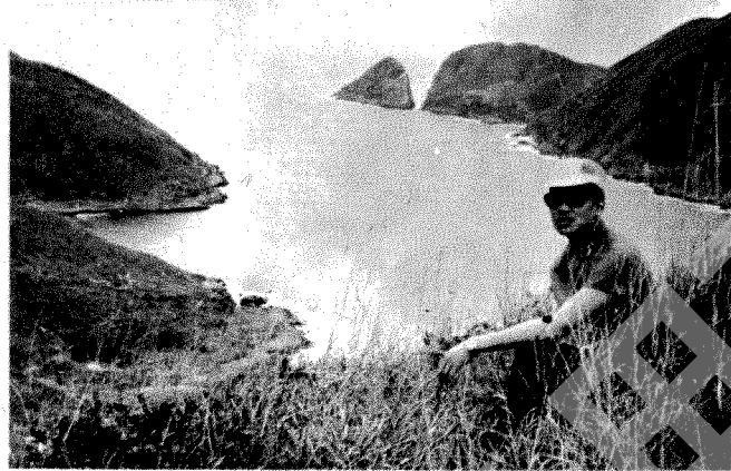
官門東端及破邊洲

水道南岸為糧船灣洲北部，海岸綫迂迴曲折，海灣連綿，若沿岸「細邊」看官門，又有一番景象。在石竹坑與南沙埔之間有一列長長的沙灘遙對彼岸沙咀村畔一小灘，直綫相距約一千七百呎，附近河床淤泥沙岩壅積，若值潮降，水深僅及膝，此為涉渡官門水道之正確位置。筆者年前曾作偵密之研究與安排，終於順利安全渡過，全程約需十分鐘，祇要顧及安全，此舉不失為履險探奇之旅程中一個甚具刺激性的節目。自南沙埔沿岸東行，不久過官門