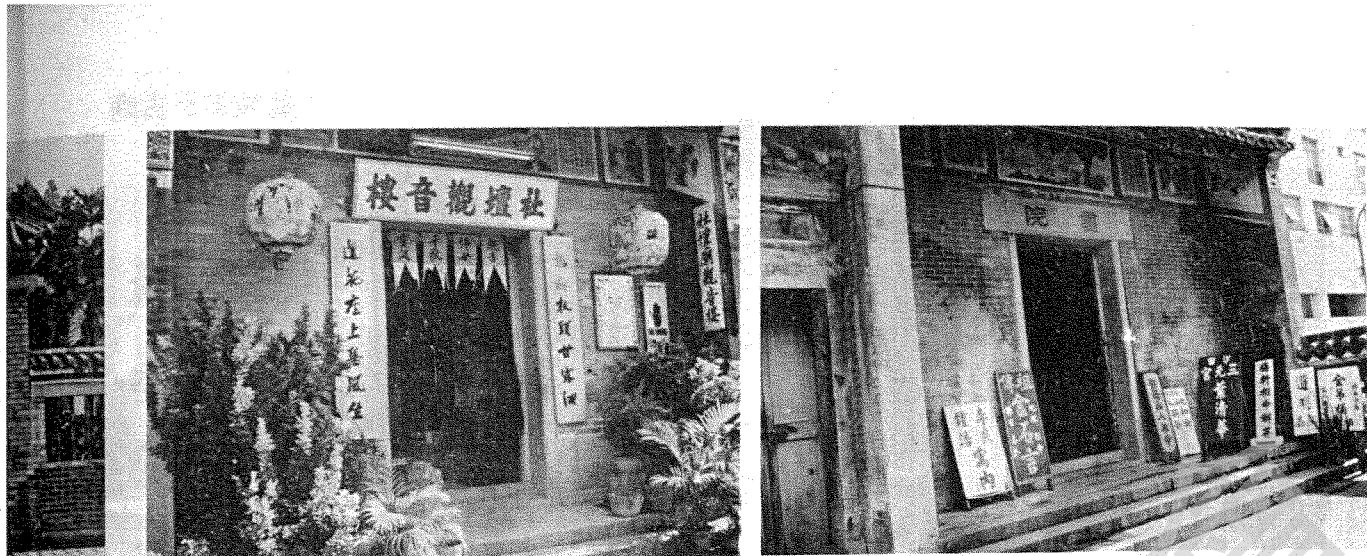
九龍榕樹頭大廟，由左至右依次為「觀音古廟」、「城隍廟」、「天后古廟」、「社壇觀音樓」及「書院」

側供人追惜，「鶴」字真刻仍存，今大石立於廟後，有鐵絲網隔開，遊人只可隔網側看，難作正面攝影。