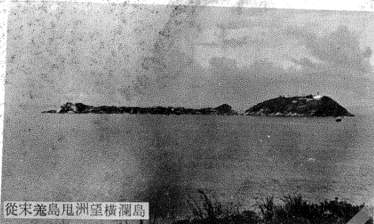
從宋差島用洲望橫瀾島

橫瀾（今稱橫瀾）為香港水域東南邊緣一小島，其上建有香港最古及最具規模之燈塔，橫瀾島形如「一」字橫列，即其得名之由，今稱橫瀾乃取其橫障波瀾之意，島上雖屬「政府重地」，若經循正當手續申請，獲批准登臨參觀的機會很高。 在好些古籍中都可以找到有關蒲苔及宋差的資料，橫瀾却獨付闕如，記載較詳細者祇有陳壽彭之「中國江海險要圖誌」一書，並付地圖。現將該書中「橫瀾」一節圖文抄錄如后： 橫瀾（Wag Lan）一作橫瀾洲在宋差之東。四分迷當之三之遠。濯濯然小石島也，小船出入。分為二股。而常從於東向也。離其東差遠處。水深十六七拓。此島之南向。西北隅。有浮錨三。以為船隻停泊之所。然所泊必須離其西岸也。策慶石（Sook）出水十八尺。在橫瀾西南尖之西二纜之遠。同向中。西南又偏西半度。一纜有半之遠。有枝灘（Branch Shoal）者。乃一小石相距縫隙中。水深六拓。 燈塔 橫瀾之燈塔。乃兩倍光力。白色而閃爍者。言其能伸縮大小也。每一閃爍。約間半分鐘之久。高於水面二百二十五尺。當天氣清爽時，相距二十一迷當之遠。望之不蒙昧。其光所射於其他周圍之向。僅三分之一。如此偏東。透至正東並東南偏東也。此燈設之島之南向山崗上。 香港是世界聞名的商埠，交通方便，航運繁忙，外洋輪船多以此為中站。橫瀾島位於本港東南永域之最近線，地處要衝，緊控入港之門，為船舶進口之鑰。 橫瀾島大致分為兩部，南部渾圓如巨卵浮水，最高點海拔一百八十六呎，稱橫瀾頭，燈塔、瞭望室、氣象台、通訊系統及其他建築物均建於此島。北部為一狹長而平扁之岩石島，稜脊平均高出水平線六、七十呎，除中部西坡一石砌神龕外別無任何建築物。兩島一字斜列，中隔橫瀾門，兩島不能徒步串走。橫瀾頭之西有出水礁排一組，漁民稱之為橫瀾排。橫瀾全島面積僅零四一平方哩，在燈塔建成以前為無人荒島。 橫瀾燈塔矗立於橫瀾頭崗頂，為南中國海主要燈塔之一，建於一八九三年，當時隸屬中國海關（Imperial Chinese Marine Custom）管理，