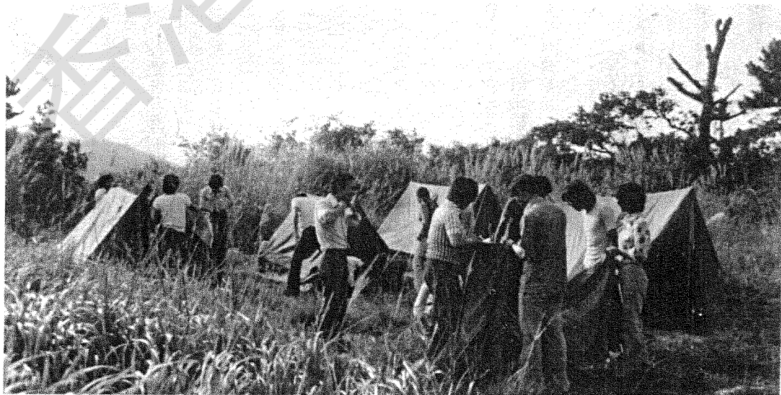
各組營友忙於紮營