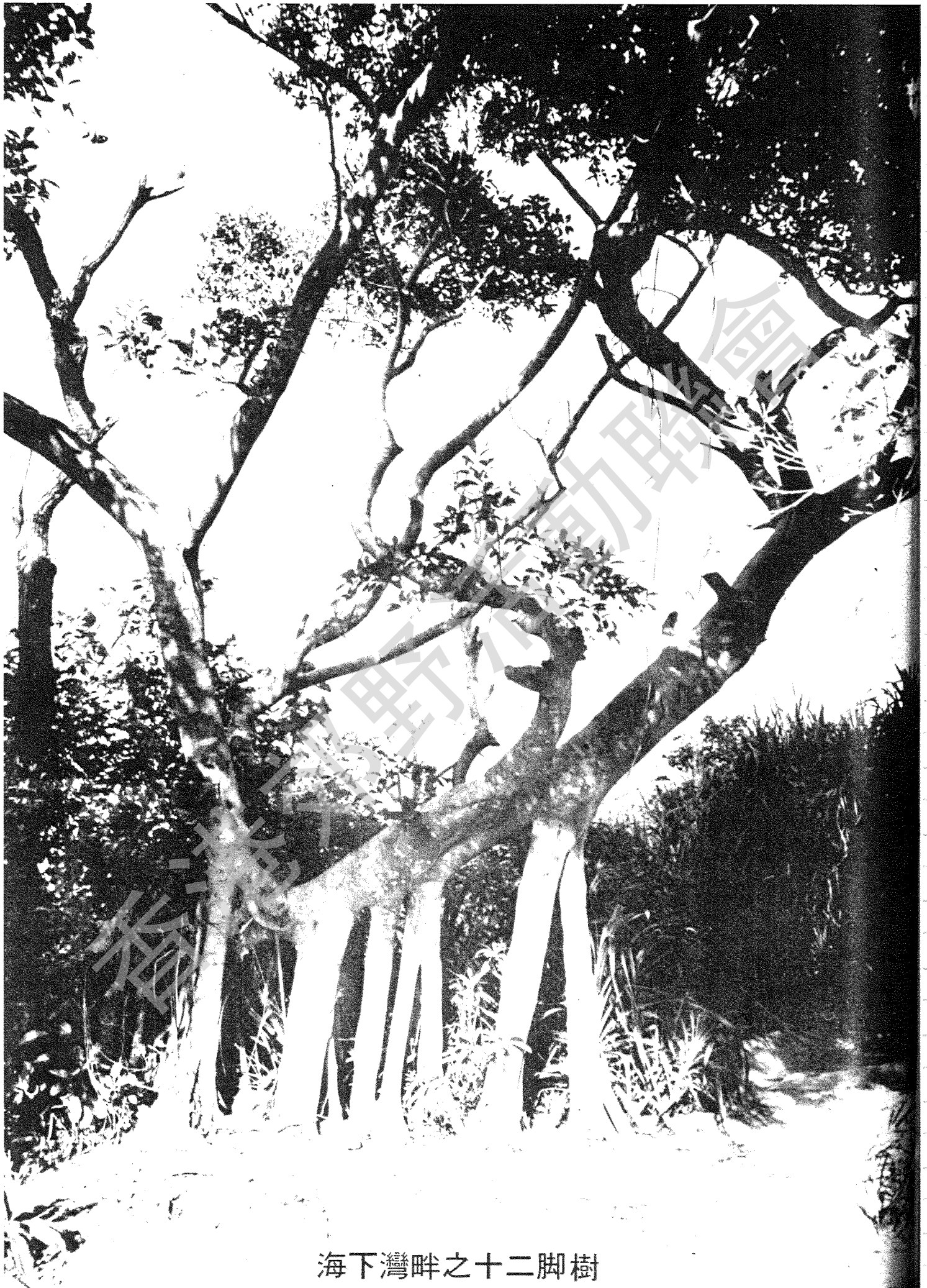
海下灣畔之十二脚樹