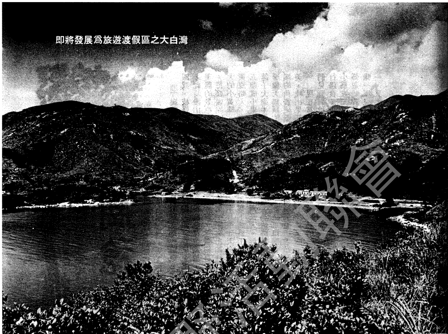
即將發展為旅遊渡假區之大白灣

區內之交通服務由發展商提供，一共將有二百四十輛車，其中包括有巴士、的士、租用車與小貨車等。並將有纜車由購物中心連接在山頂之娛樂區。