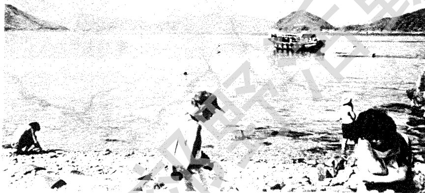
石刻所在岩壁 鮑魚角～石灘山邊