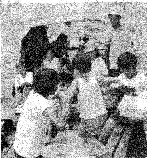
小行友躍上駁艇情景