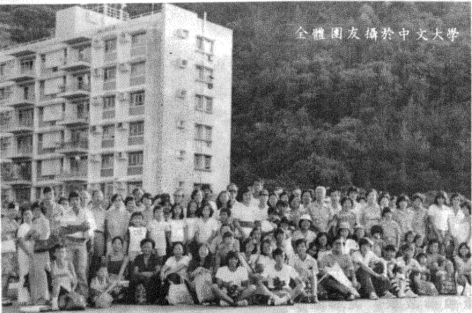
全體團友攝於中文大學